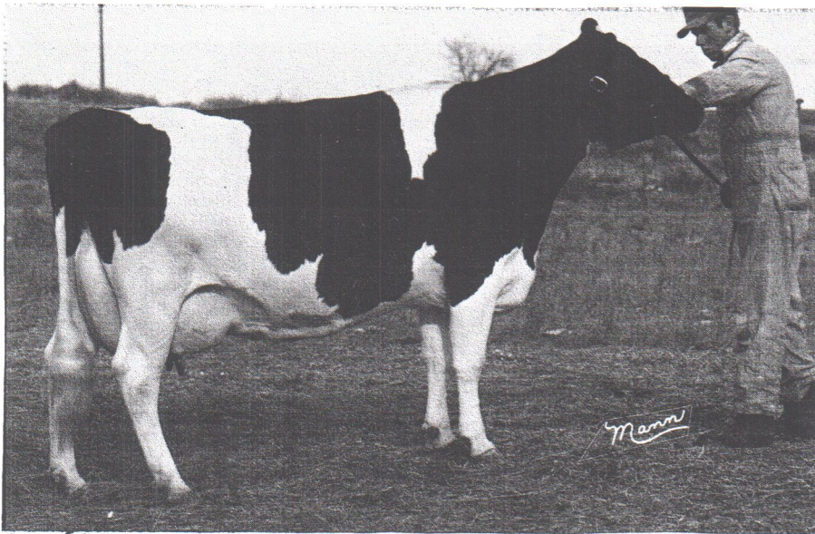
Skyway Esteem (4E-93-GMD)